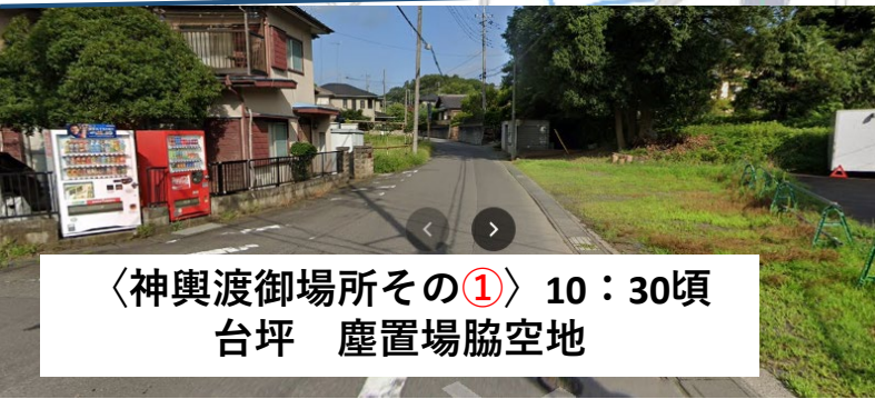
〈神輿渡御場所その①〉 10：30頃 台坪 塵置場脇空地