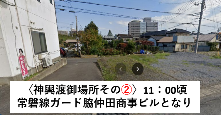
〈神輿渡御場所その②〉 11：00頃 常磐線ガード脇仲田商事ビルとなり