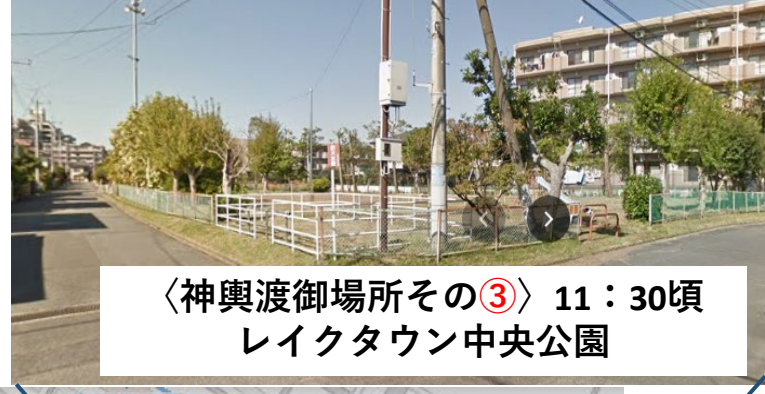
〈神輿渡御場所その③〉 11：30頃 レイクタウン中央公園